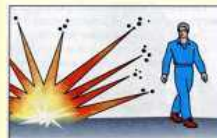
Опасная поза при взрыве